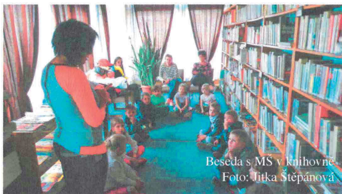
Beseda s MŠ v knihovně