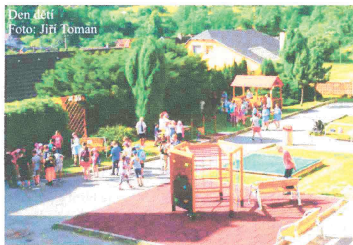
Den dětí

7. 5. si čtvrtáci vyjeli s ornitologem Dušanem Rossí na Prudkou. Netušili, jak je těžké rozeznat jemné odchylky ve zpěvu ptáků. Vlákem dojeli do Borače a pěšky se vraceli na Prudkou. Po cestě poslouchali ptáčky a velmi pěkný výklad pana ornitologa. Občas měli štěstí a některého zpěváčka zahlédli.