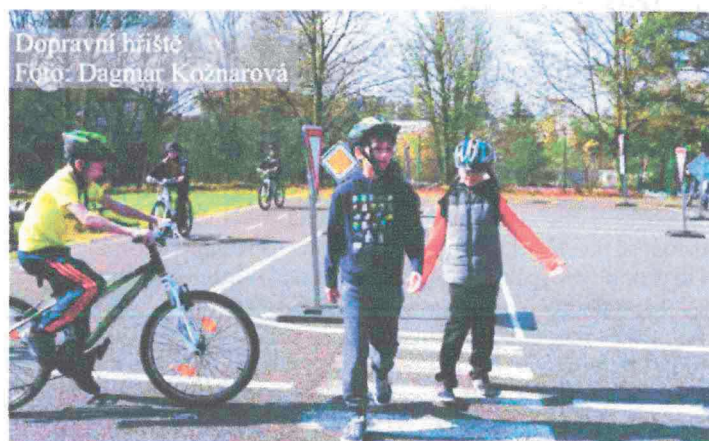
Dopravní hřiště

Zda jsou děti zdatné, odhalila soutěž ve šplhu. A to nejen naše školní kolo, ale zúčastňujeme se i okřskového kola v Bystřici nad Pernštejnem a býváme úspěšní. Tím ale pohyb našich dětí nekončil. Hned po šplhu se pustily do splnění školního trojboje. Ani cizí jazyk nezanedbáváme – děti si prošly různými třídními soutěžemi.