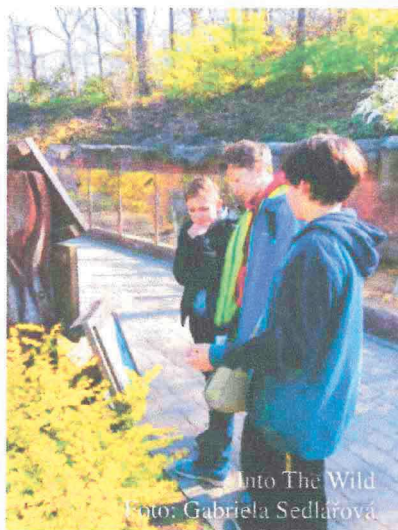
Into The Wild

V úterý 16. dubna se v brněnské ZOO uskutečnil další ročník atraktivní soutěže v anglickém jazyce s názvem INTO THE WILD. I letos se naše škola zúčastnila.