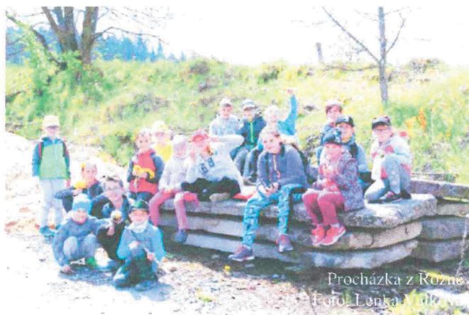
Procházka z Rožné

8. května 2019 se uskutečnila jedna z dalších společných akcí dětí a rodičů 4. třídy. Vlakem jsme odjeli do Rožné. Odtud jsme se vypravili po žluté turistické značce směrem k Nedvědici. Čekala nás túra dlouhá necelých 10 km. Vedla nás nádhernou jarní přírodou přes Suché louky, Věžnou, Smrček a po naučné stezce na Vrbovou a Žlebem do Nedvědice. Během cesty jsme využili zkušenosti a znalosti našich mladých zálesáků, kteří se postarali o oheň a tím i o teplý oběd v podobě špekáčků. Se sluncem nad hlavou a větrem v zádech jsme si užili pěkný sváteční den.