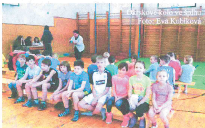
Okřskové kolo ve šplhu

Zápis do 1. třídy se v letošním školním roce konal 17. dubna. Budoucí prvňáčci dostali u zápisu nejen dárečky, které pro ně vyrobili jejich starší spolužáci (ať už v hodinách pracovní výchovy nebo ve školní družině), ale i kulíčky na pomůcky do výtvarné výchovy. Spolupráce našeho 1. ročníku a MŠ byla v letošním školním roce velmi zdařilá. Naši prvňáčci se s budoucími školáky viděli nejen na společných divadelních představeních, ale často se setkali i přímo ve škole při vyučování. Taktéž se v klidu adaptovali na školu, do které po prázdninách nastupují. V červnu navštívili školu také rodiče našich prvňáčků. Prváčci byli pasováni na „Malé čtenáře“. Ukázkou čtení zvládli všichni na jedničku, obdrželi stuhu Malého čtenáře a knihu s prvním