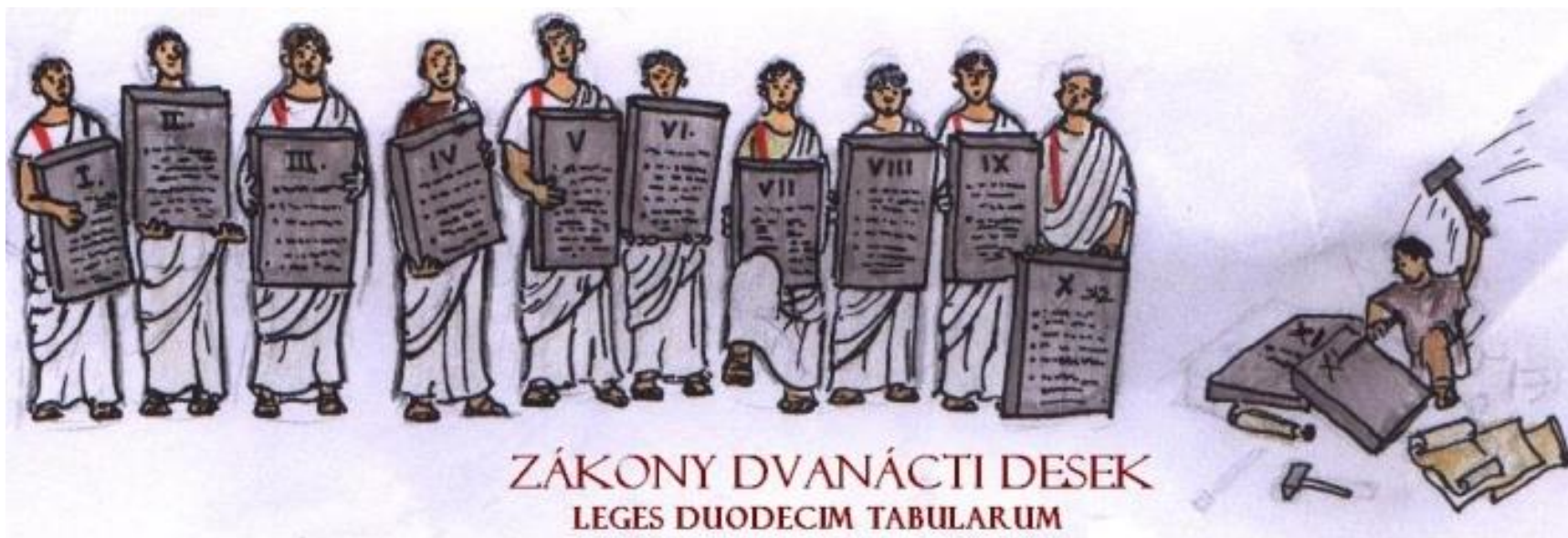
ZÁKONY DVANÁCTI DESEK LEGES DUODECIM TABULARUM