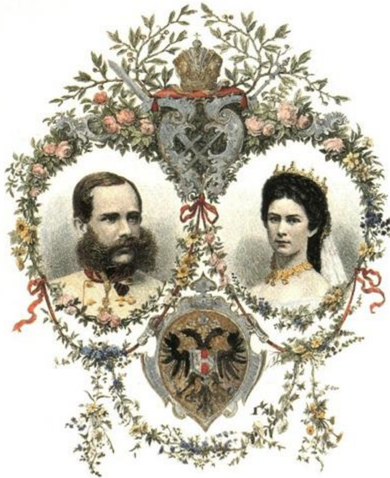
František Josef I. s manželkou