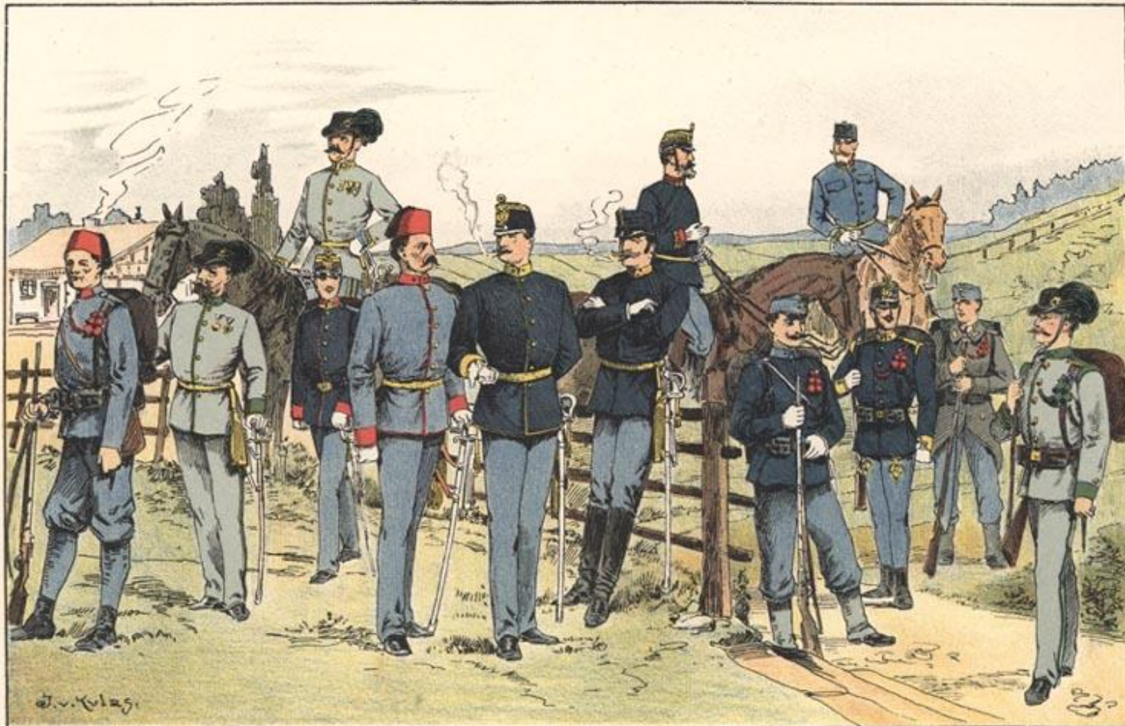
Bosnisch-herceg. Infanteri. Parade Jäger-Hauptm. Parade Kadett-Offiz. Stellv. Inf. Parade Bosnisch-herceg. Infanteri.-Leutn. (Mohamed.) Parade Infanteri.-Leutn. Parade Inf.-Oberleutn. Wachtmeister. Infanteri.-Corporal Wachtmeisterstellung Ungar. Inf. Reg.-Gefreiter Parade Unterjäger Parade Jäger-Stabsoffiz. Parade Inf.-Oberleutn. Parade Bosnisch-herceg. Inf.-Stabsoffiz. Wachtmeister. Deutsch. Infanteri.- Reg.-Infanteri. R.-Adjut., Hauptst.