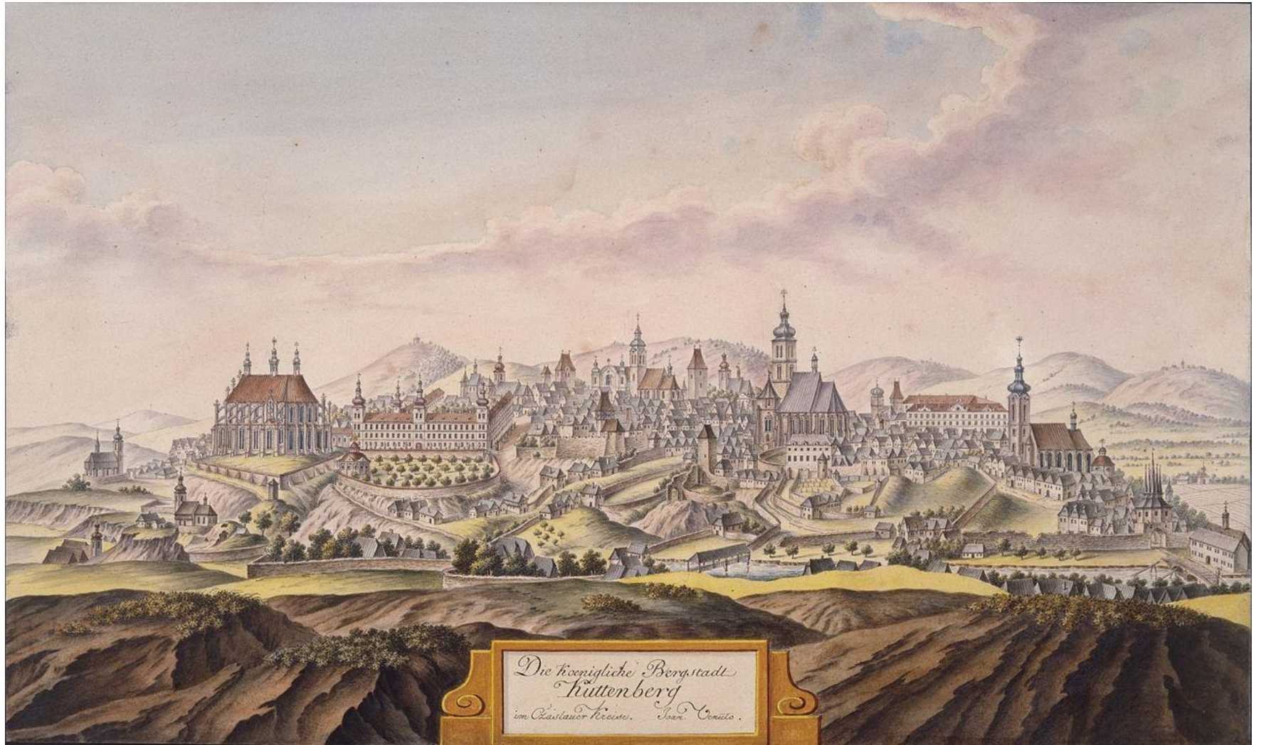
Die königliche Bergstadt Hüttenberg im Cassauer Kreisse. Joh. Senats.