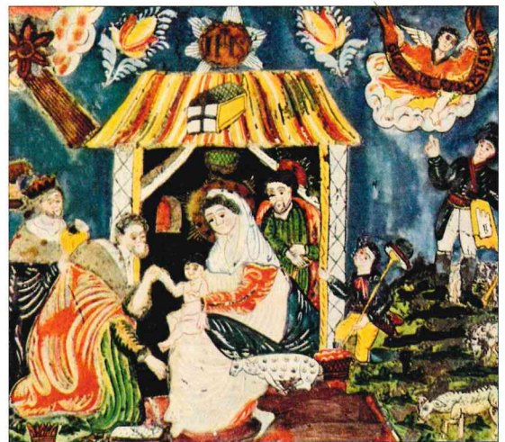
Narození Ježíška – klanění tří králů (lidová malba na skle)

Masopust trval od Tří králů (6. ledna) do Popeleční středy . Oslavoval konec zimy a začátek jara. Byl spojován s vynášením zimy, s průvody masek a s karnevalem. Ve městech se v tomto období konaly bály, maškarní plesy a taneční zábavy. Po masopustu následoval až do Velikonoc 40denní půst.