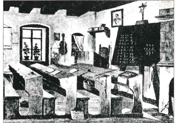
Třída ve škole ve 2. polovině 19. stol.

Porovnejte školství 19. století s dnešním stavem.