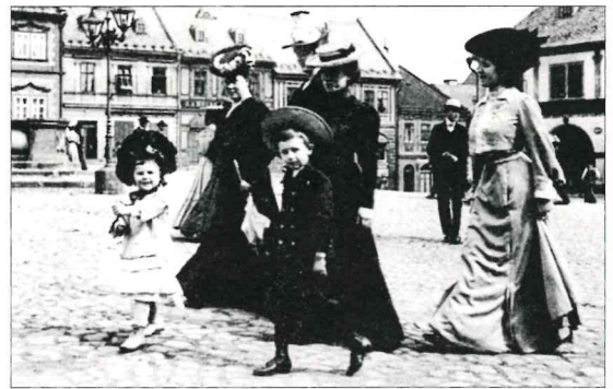
Česká měšťanská rodina na procházce

V neděli ráno se obvykle celá rodina vypravila do kostela, po obědě na výlet, na procházku nebo na návštěvu příbuzných.