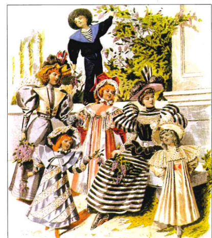
Dětská móda šířící se z Francie Vznik speciálního dětského obleku byl novinkou 19. století. Do této doby nosily děti stejné šaty jako dospělí.