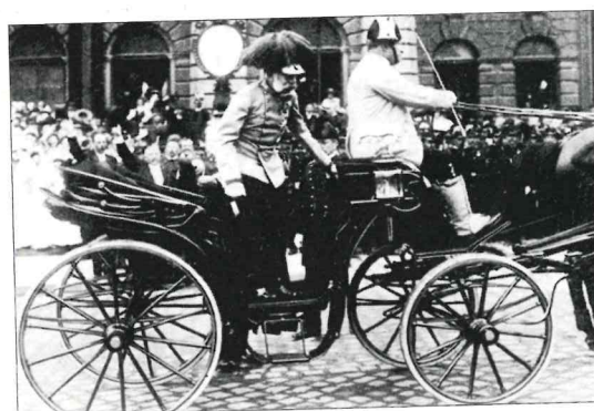
Císař František Josef I. vystupuje z kočáru za slavnostního veselí, které doprovázelo jeho oficiální návštěvu v Praze roku 1907