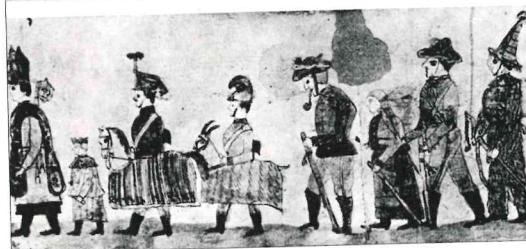
Masopustní průvod – kresba lidového malíře z konce 19. století