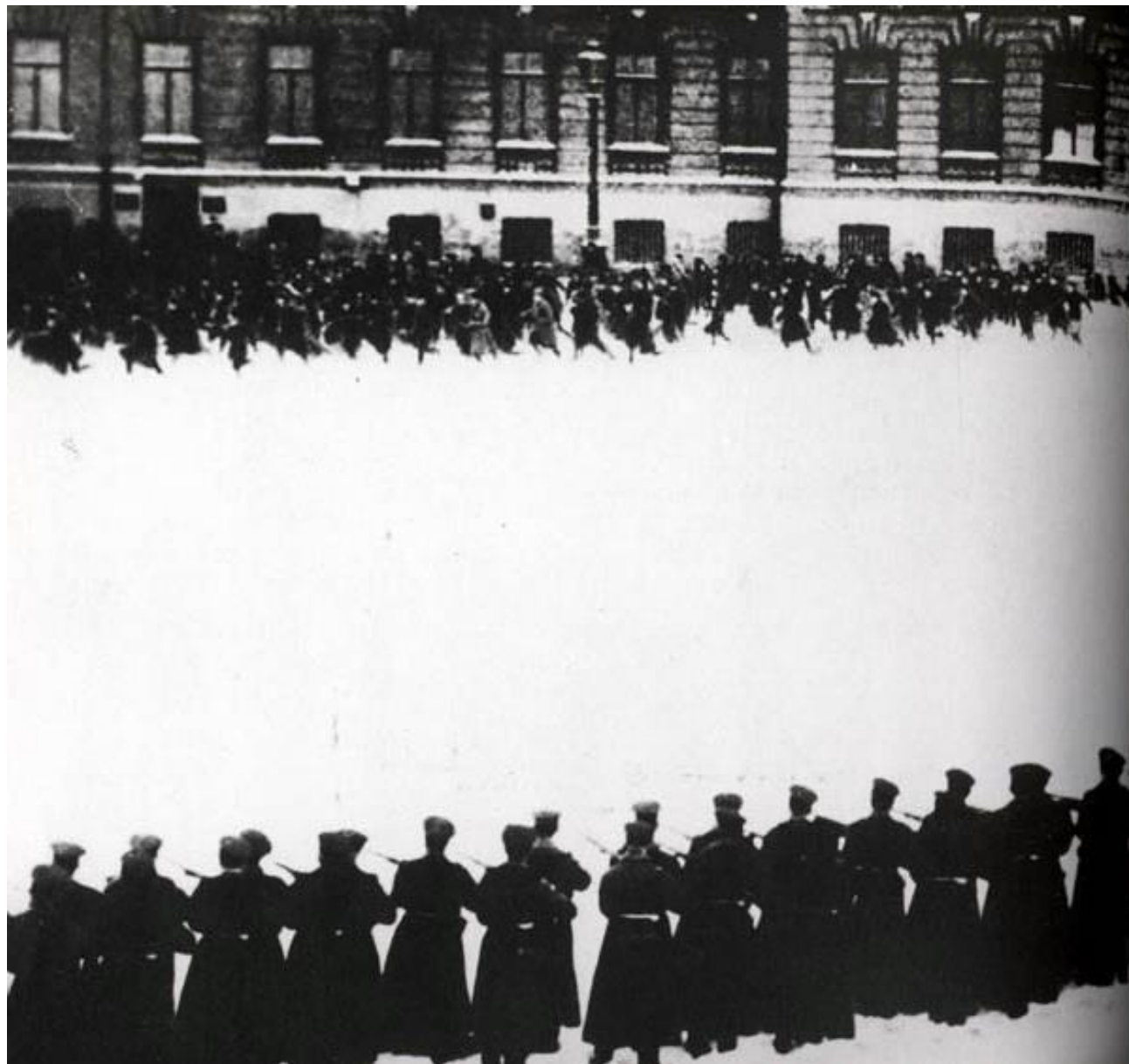
střelba do demonstrantů v roce 1905