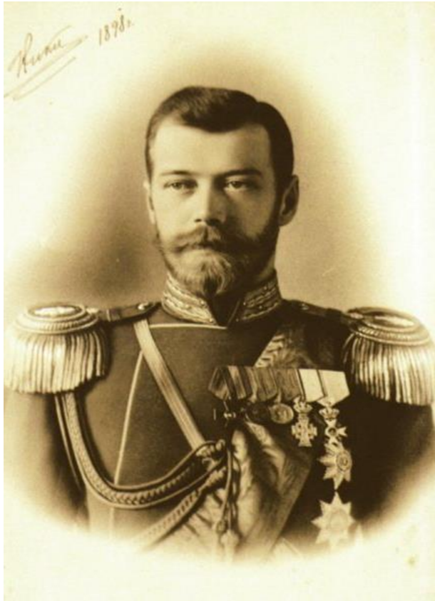
car Mikuláš II. (1894-1917)

1. světová válka - porážky → hospodářská krize 1917 Únorová revoluce (březen) – car Mikuláš II. odstoupil, vznik prozatímní vlády a sovětů – pokračování ve válce