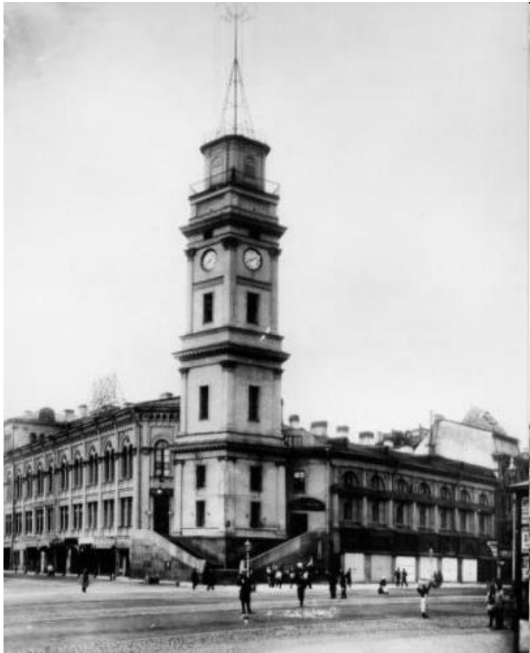
Duma v Petrohradě

nakonec ale Duma rozpuštěna Stolypinova reforma – rolníci získali půdu do soukromého vlastnictví → hospodářský růst