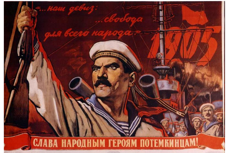
Sláva národním hrdinům na Potěmkinu