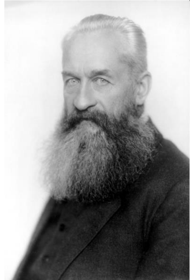
Lvov – předseda vlády