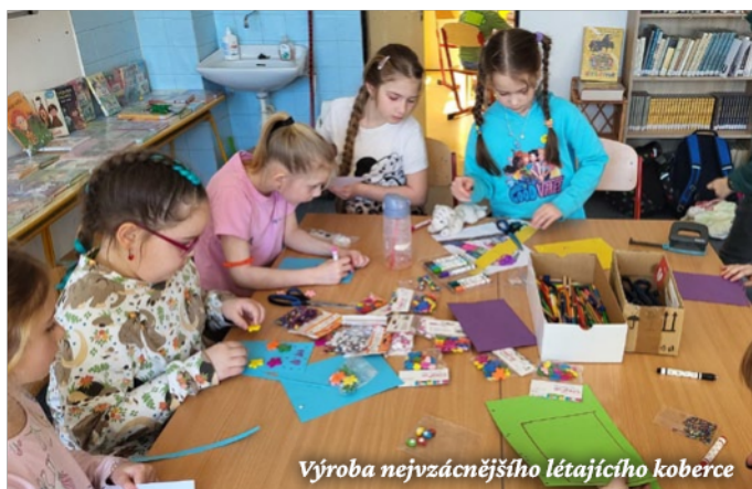
Výroba nejvzácnějšího létajícího koberce