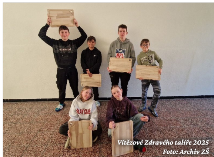
Vítězové Zdravého talíře 2025