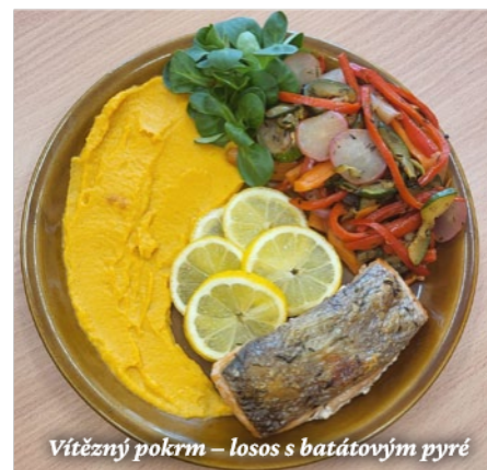
Vítězný pokrm – losos s batátovým pyré