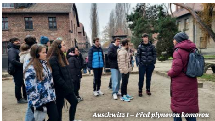
Auschwitz I – Před plynovou komorou