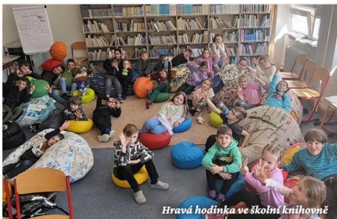
Hravá hodinka ve školní knihovně