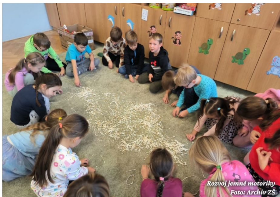
Rozvoj jemné motoriky