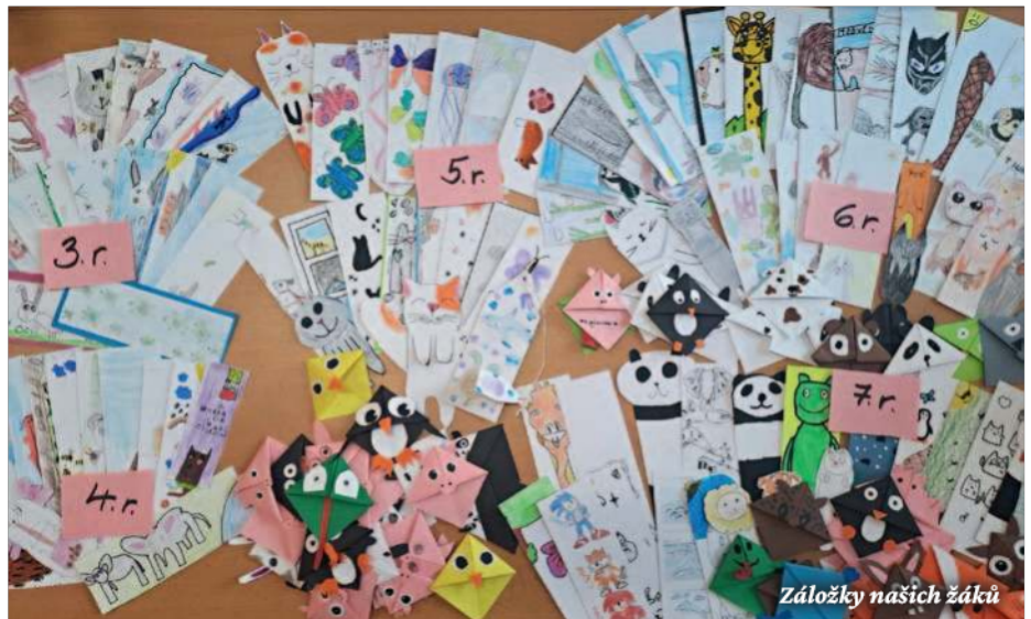
Záložky našich žáků