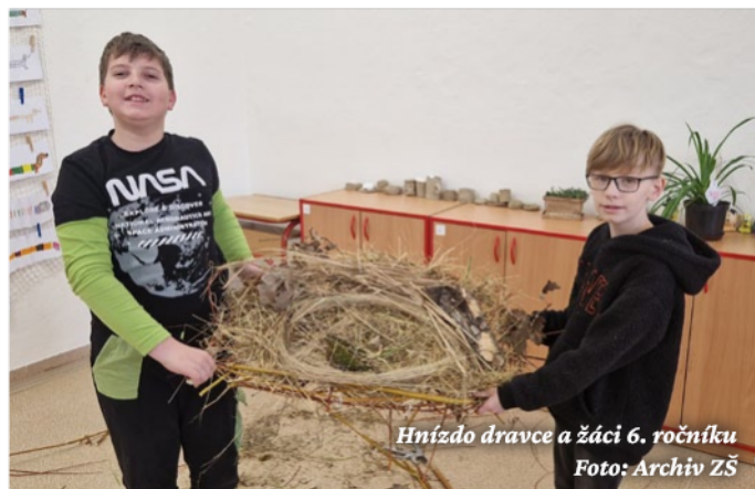
Hnízdo dravce a žáci 6. ročníku