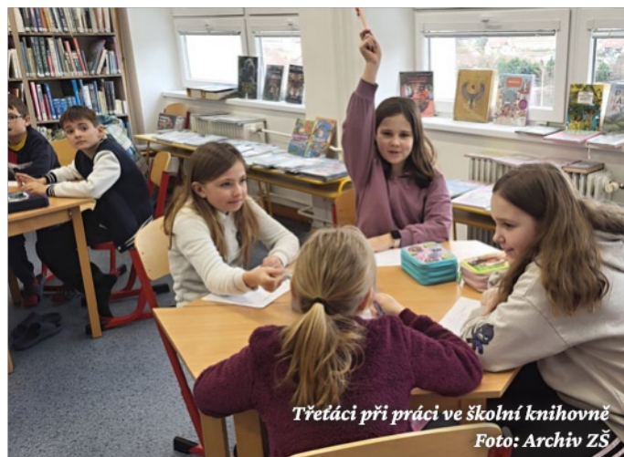
Třetáci při práci ve školní knihovně