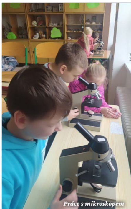
Práce s mikroskopem