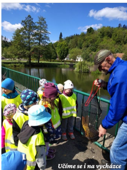
Učíme se i na vycházce