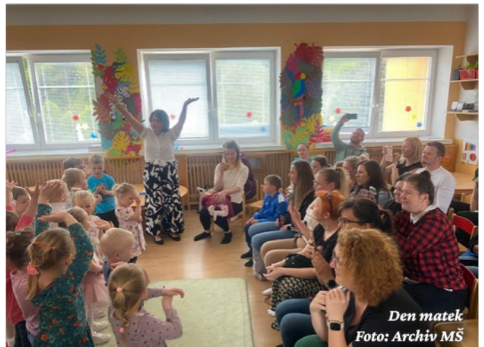
Den matek