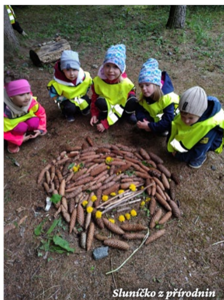
Sluníčko z přírodnin