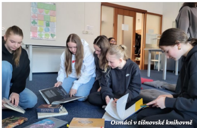
Osmáci v tišnovské knihovně