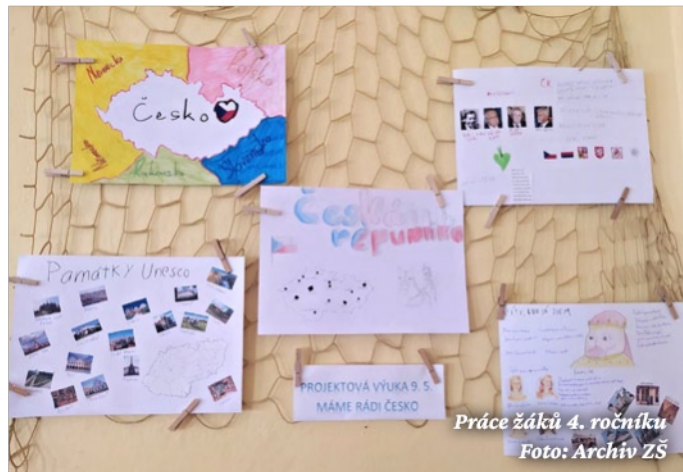
Práce žáků 4. ročníku