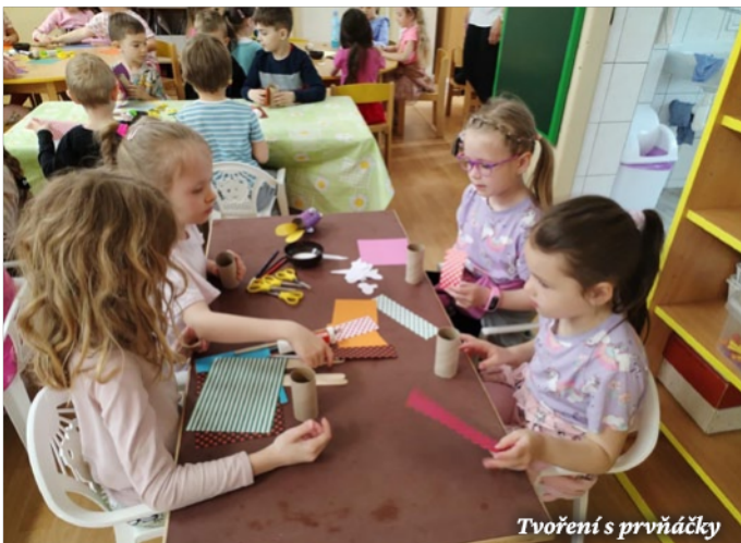
Tvoření s prvňáčky