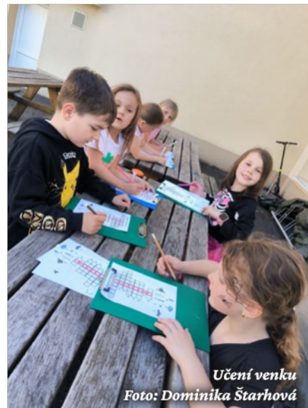
Učení venku