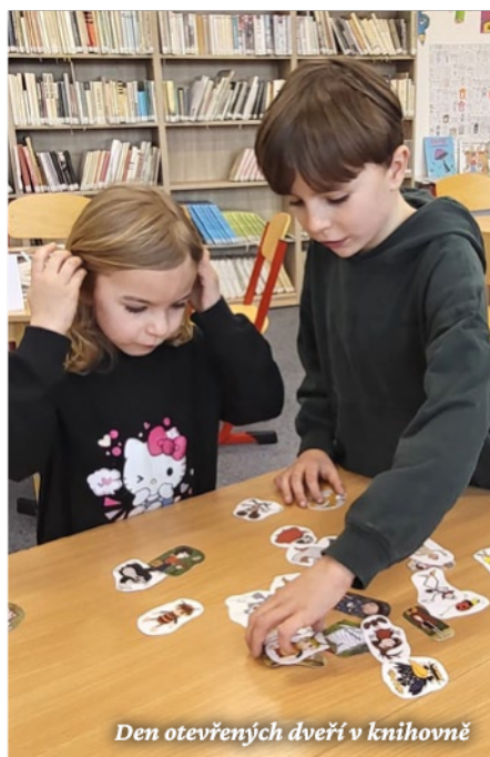
Den otevřených dveří v knihovně