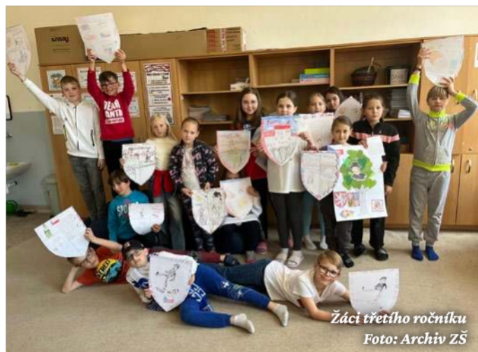
Žáci třetího ročníku