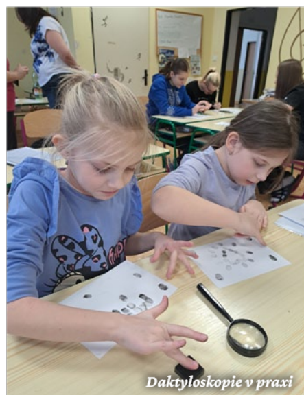
Daktyloskopie v praxi