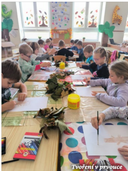
Tvoření v pruvce