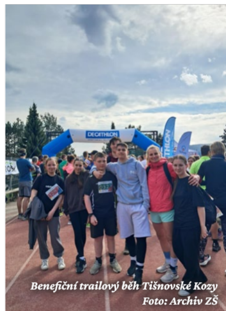
Benefiční trailový běh Tišnovské Kozy

kteří jste šli nad své hranice nebo po nich a v duchu fair play překonávali pomyslnou laťku 10 000. A co by mě potěšilo nejvíc? Abyste si čas strávený venku, ať už chůzí, na kole, bruslích nebo koloběž-