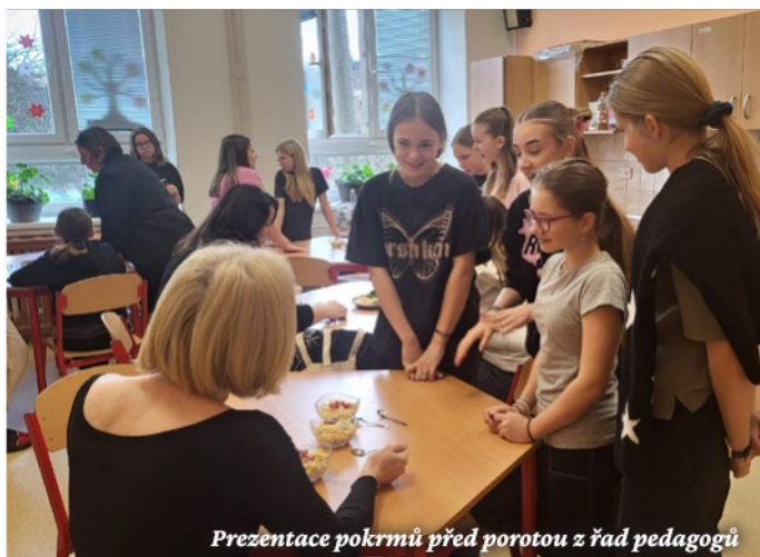
Prezentace pokrmů před porotou z řad pedagogů