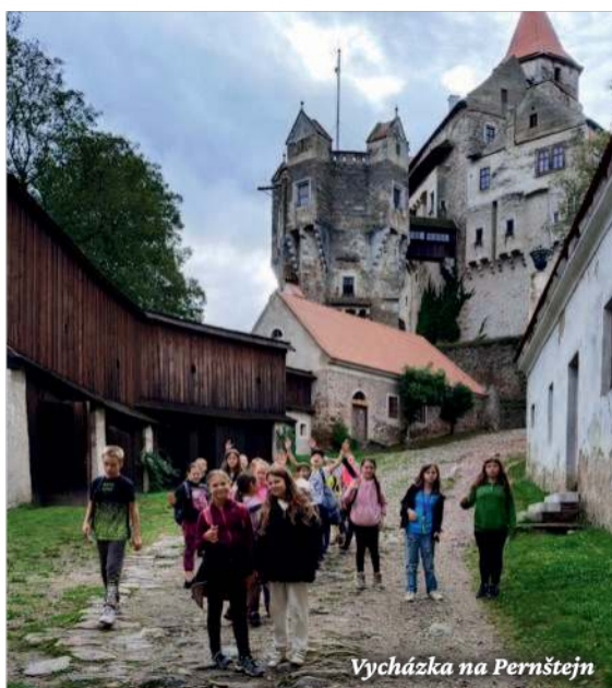
Vycházka na Pernštejn

A hurá na Pernštejn! Zase! Však je to gotický hrad, a tak se nám to hodí k doplnění učiva vlastivědy! Tentokrát jsme se byli podívat, jak podzim čaruje s barvami – navštívili jsme výstavu Podzim