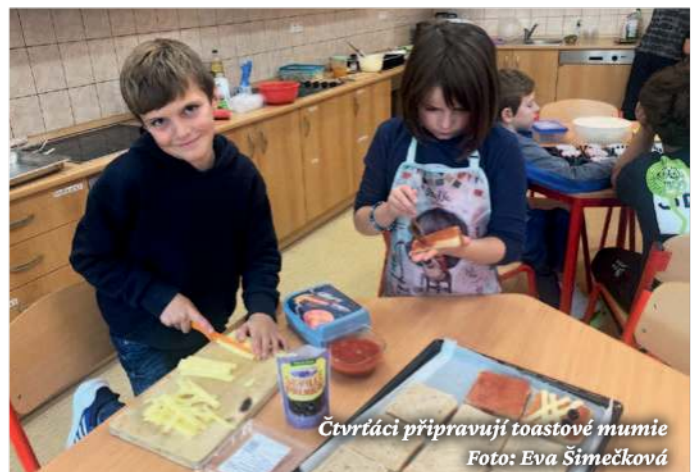
Čtvrtáci připravují toastové mumie

Dagmar Lolová třídní učitelka 3. ročníku