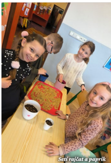
Seti rajčat a paprik