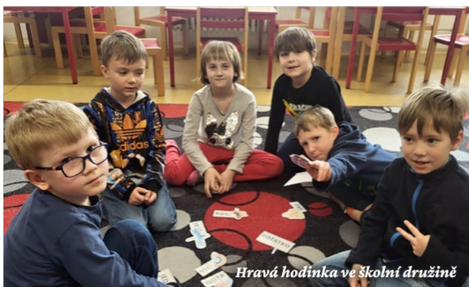
Hravá hodinka ve školní družině