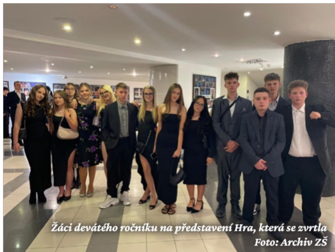
Žáci devátého ročníku na představení Hra, která se zvrtila

12. května jsme se – už jenom jedním autobusem plným žáků z druhého stupně – vydali na novinku MdB s názvem Hra, která se zvrtila . Jednalo se o detektivní komedii, ve které se nám dostalo opravdu hodně velké dávky humoru. Ten oceňovali především šestáci, hlavně u diváček z 8. a 9. ročníku zůstala Matilda na 1. místě.