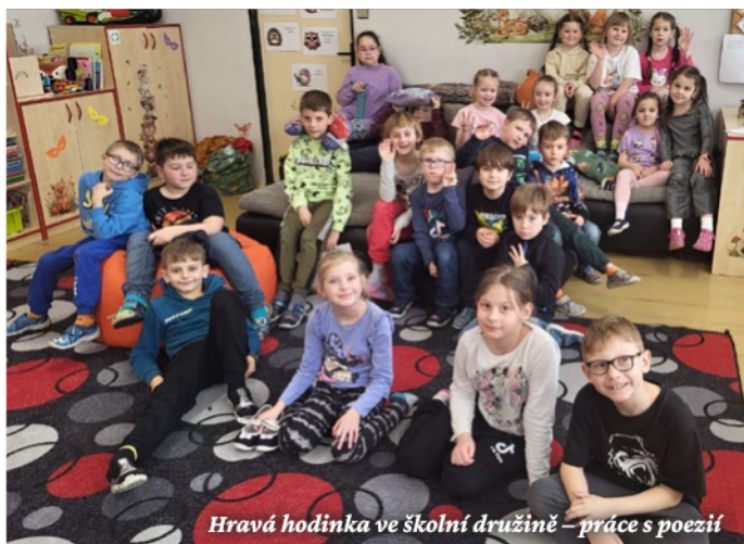
Hravá hodinka ve školní družině – práce s poezií