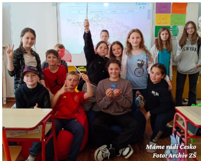
Máme rádi Česko