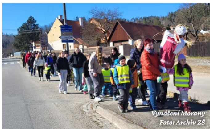
Vynášení Morany