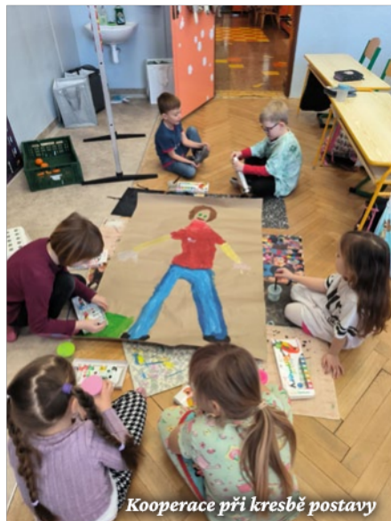
Kooperace při kresbě postavy