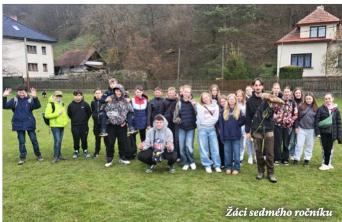
Žáci sedmého ročníku