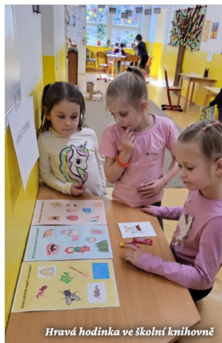
Hravá hodinka ve školní knihovně