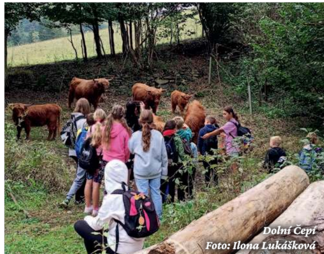
Dolní Čepí