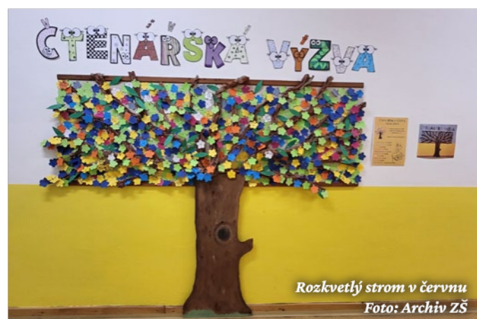
Rozkvetlý strom v červnu