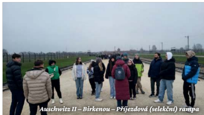
Auschwitz II – Birkenou – Příjezdová (selekční) rampa