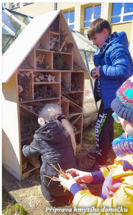
Příprava hmyzího domečku