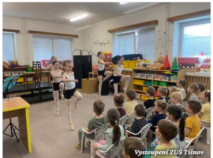
Vystoupení ZUŠ Tišnov