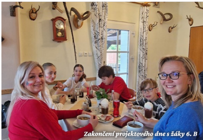
Zakončení projektového dne s žáky 6. B