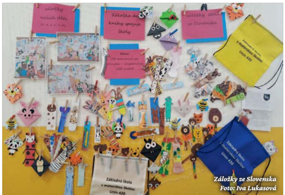
Záložky ze Slovenska