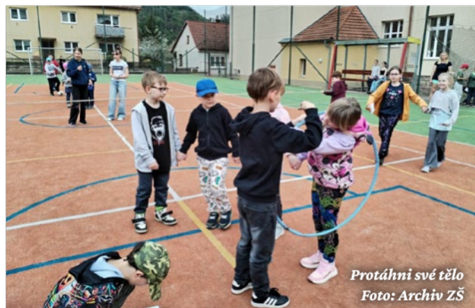
Protáhni své tělo