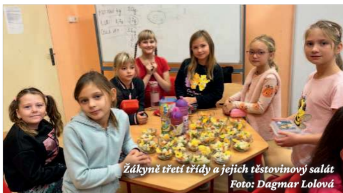
Žákyně třetí třídy a jejich těstovinový salát

Strašidelné toasty, těstovinový salát, pomazánku z červené řepy s ozdobou netopýra a jako sladká tečka se podávaly čokoládové muffiny. Děti vaření opravdu bavilo, svačinky se podařily a všem moc chutnaly.