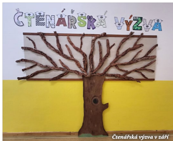
Čtenářská výzva v září