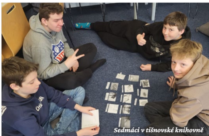
Seďmáci v tišnovské knihovně